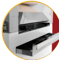
Plateaux escamotables et amovibles en acier inoxydable

CASABLANCA 55, Avenue Houmane El Fetouaki casablanca Tél: +212 (0) 5 22 47 22 21 Fax: +212 (0) 5 22 44 47 48 Email: commercial@golden-equipement.com