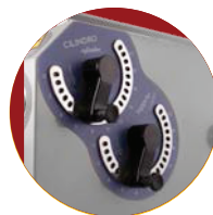
Poignées de réglage levier avec 22 positions.